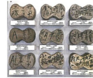
廣井の制作した試供体 現在4000個ほど残存