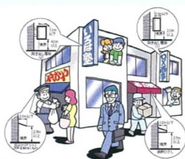
道路占用許可が必要な物件例

当グループでは国道管理者に提出された占用許可申請が適切であるか判定します。また、歩道の切り下げなどの道路構造の変更、不法占用の指導取締り補助などにも対応しています。