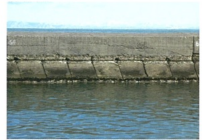
設置された斜塊ブロック