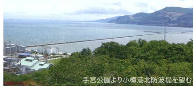
手宮公園より小樽港北防波堤を望む

小樽は特に冬季波浪の影響が大きく、港湾施設及び船舶の安全のため、防波堤建設が待望されていました。廣井はコンクリートブロックを組み合わせ、捨石基礎の上に配置する防波堤計画を立案します。防波堤ブロックは波力への抵抗が増すよう71.6度に斜積みする「斜塊ブロック」工法を採用しました。また、国産化コンクリートは築港事業での亀裂事故が多く、外洋の荒波に耐え得るコンクリートブロック開発は喫緊の課題でした。廣井は道内で産出される火山灰をセメントに混入して強度を増す方法を採用し、より大きいブロックの製造を可能としました。こうした新技術の導入により、1908(明治41)年小樽港北防波堤が完成します。これは国内初のコンクリート長大防波堤であり、100年の荒波に耐え、今もなお供用されています。