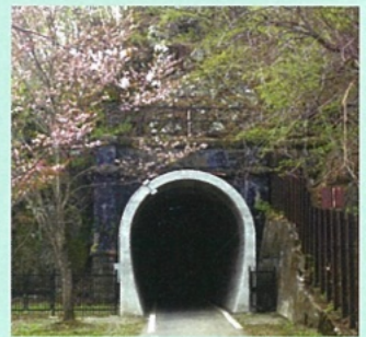
神居古潭トンネル

トンネルに触れることで、我が国のトンネル技術の足跡をたどることが可能であると考えられる。 道内には2箇所の土木遺産に認定されたトンネルがあり、その一つである旧函館本線神居古潭トンネル群(平成27年認定)は、琵琶湖疎水を完成に導いた田邊朔郎が中心となって建設された。工事は膨張性の蛇紋岩に難航するも1897(明治29)年完成、さらに険しい断崖を縫うようにして路線改良工事は続き、昭和2~3年には、春志内、伊納の各トンネルが完成した。これらトンネル群は、約70年の間道内幹線鉄道輸送路を支えた。廃線後は、我が国で初めてサイクリングロードに転用し、補強工事を経て現在の姿で保存・活用され、大動脈を支えた記念碑として地域に誇れる価値を有している。